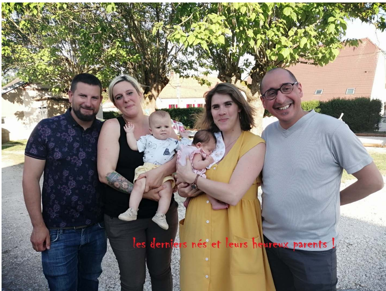
les derniers nés et leurs heureux parents !