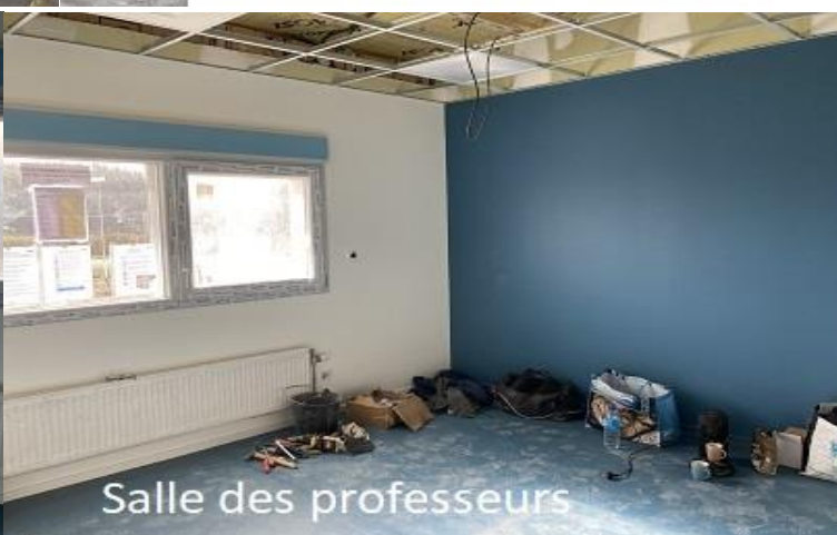
Salle des professeurs