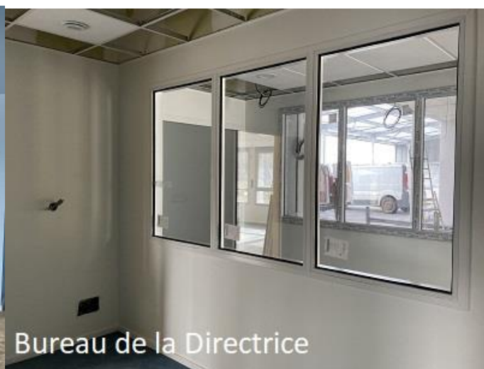
Bureau de la Directrice