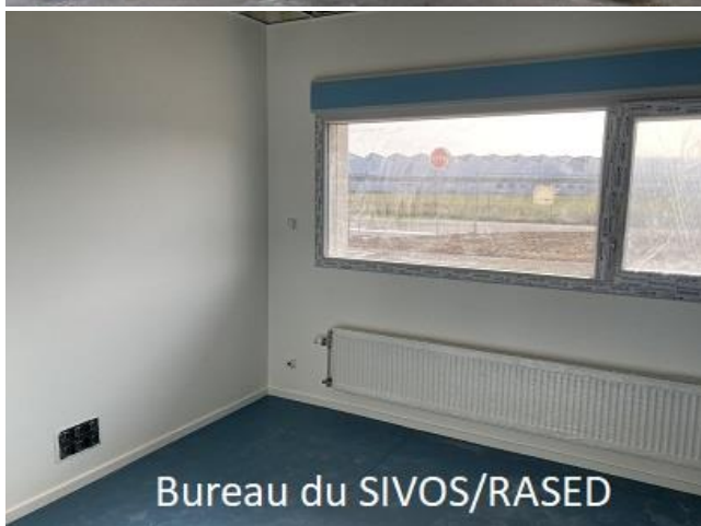
Bureau du SIVOS/RASED