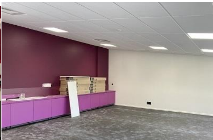
La classe Violette - aile nord