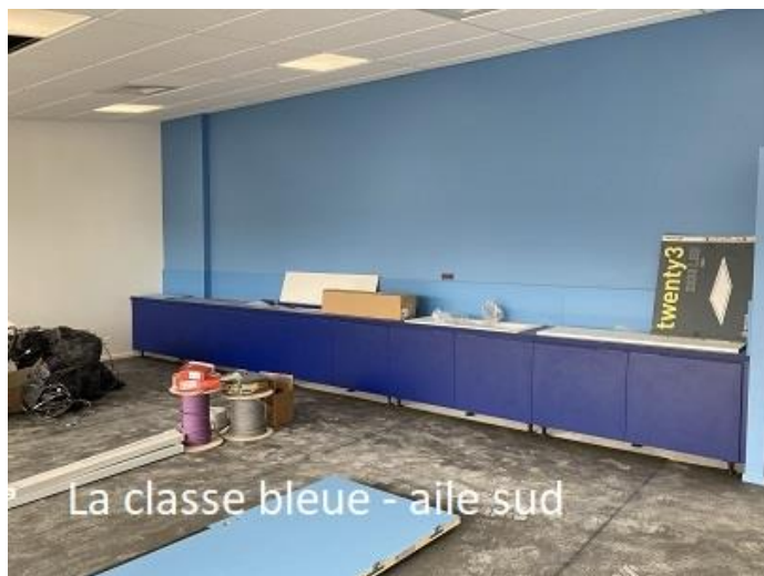
La classe bleue - aile sud